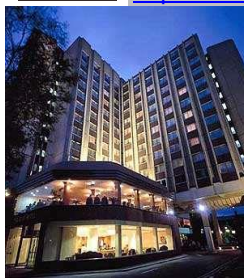
Ibis Earls Court